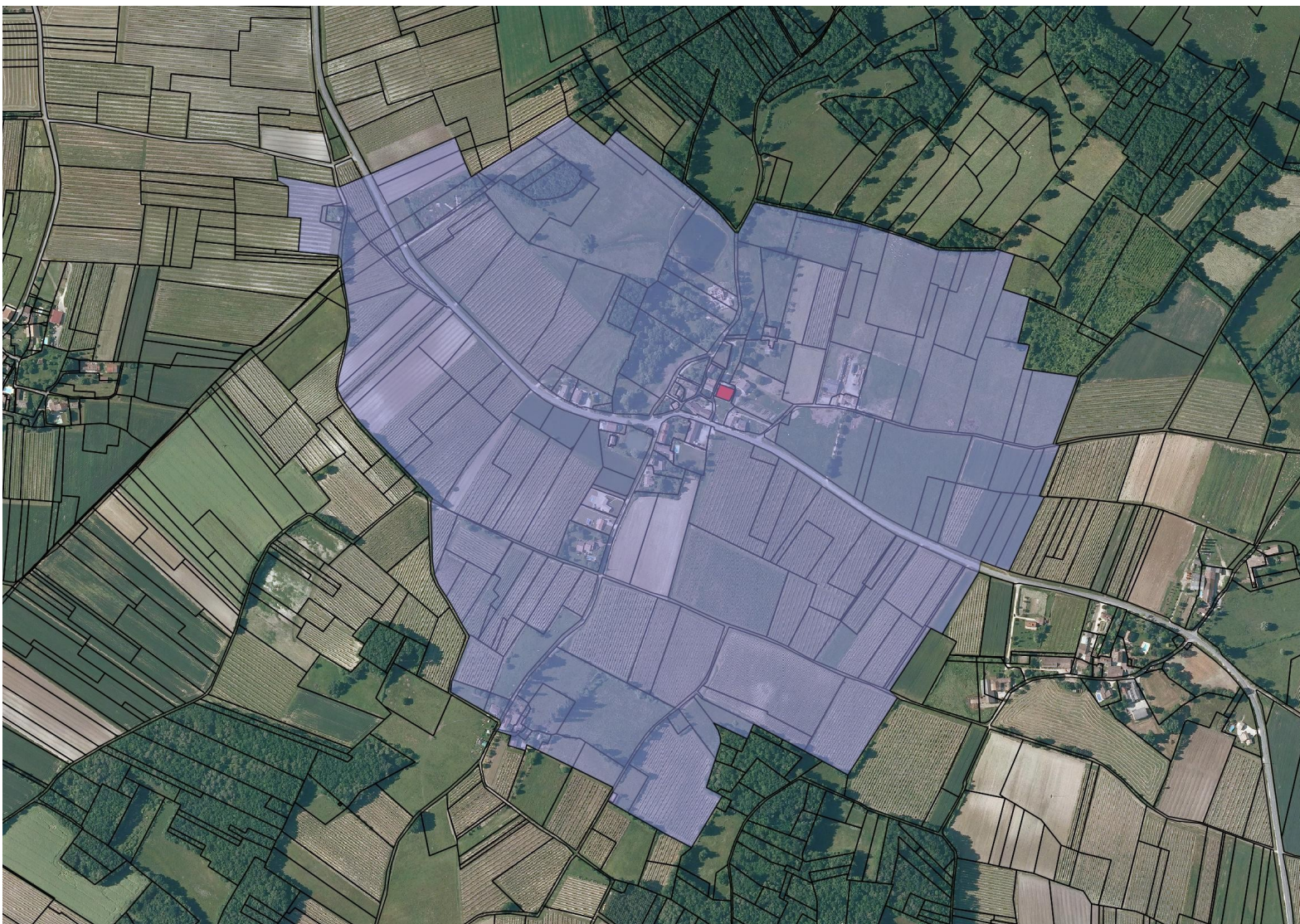
Annexe 1/1 Plan du Périmètre Délimité des Abords de l'église de Lestignac et son cimetière à Sigoulès sur la commune de Sigoulès et Flaageac